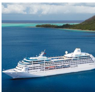
PACIFIC PRINCESS | OCEAN PRINCESS

250 710 30.200 180 mt cabine con balcone passeggeri stazza lorda lunghezza