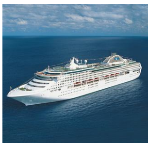
DAWN PRINCESS | SEA PRINCESS | SUN PRINCESS

Con oltre 400 cabine dotate di balcone privato, Dawn Princess, Sea Princess e Sun Princess sono le unità migliori da cui ammirare scenari maestosi. Lasciatevi ammaliare dallo scintillio delle boutiques di bordo, dalla Spa o dalla galleria d'arte. E quando è il momento della cena potete optare per una pizza appena sfornata o per una gustosa bistecca alla Sterling Steakhouse o ancora per una cena elegante al ristorante, scegliendo tra il programma tradizionale o l'innovativo Anytime Dining, che vi consente di decidere a che ora e con chi condividere i piaceri della tavola. Per un tempo scandito solo dai vostri desideri. Ognuna di queste navi è un mondo galleggiante dedicato a soddisfare ogni vostro desiderio.