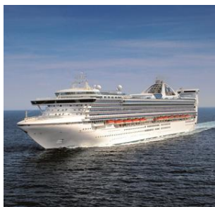
GOLDEN PRINCESS | GRAND PRINCESS | STAR PRINCESS

740 2.670 116.000 290 mt cabine con balcone passengeri stazza lorda lunghezza