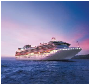
DIAMOND PRINCESS | SAPPHIRE PRINCESS

Un binomio perfetto: due incredibili unità in navigazione lungo le rotte più intriganti alla scoperta delle destinazioni più esotiche e ammalianti. Rafforzate mente e corpo presso il centro fitness oppure allenatevi sulla pista da jogging all'aperto, o concedetevi un meritato trattamento presso la Lotus Spa. una scelta di piscine, idromassaggi, bar e club, una biblioteca e un Internet Cafè e inoltre raffinati ristoranti (una steakhouse dove gustare gustose bistecche e grigliate nel migliore stile texano o la possibilità di cenare in libertà come e quando volete con il programma Anytime Dining). Tutto quello che vi aspettate da navi così grandi, qui lo troverete.