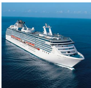
CORAL PRINCESS | ISLAND PRINCESS

400 1.990 77.000 290 mt cabine con balcone passengeri stazza lorda lunghezza